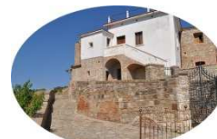
Pro - Loco Aliano - MT